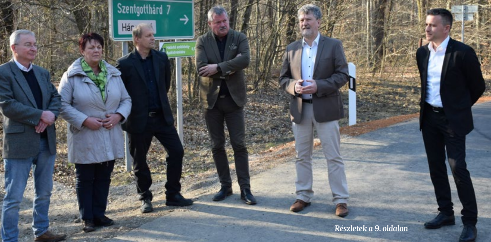
Részletek a 9. oldalon

Március 24-én átadták az Őrszentpéter-Máriaújfalu összekötő útnak a Farkasfa-Máriaújfalu térségében felújított szakaszát. A 3,3 kilométeres út építése 579 millió forintba került, a Magyar Falvak Útfelújítási Program keretében készült. Az erdők között kanyargó úton tartott avatáson önkormányzati képviselők is részt vettek.