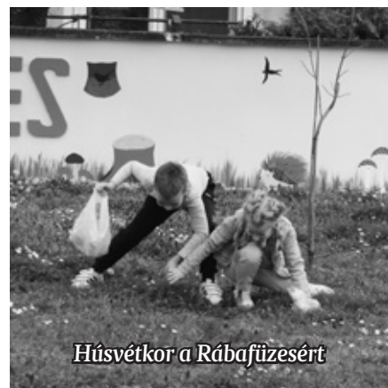
Húsvétkor a Rábafüzesért