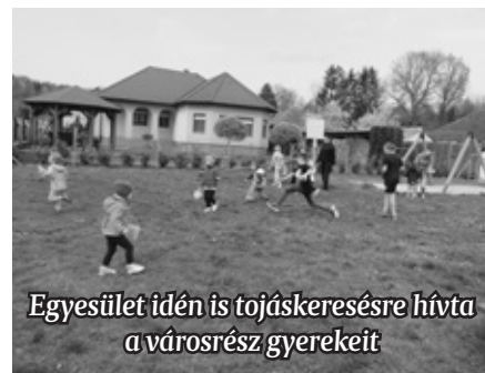
Egyesület idén is tojáskeresésre hívta a városrész gyerekeit