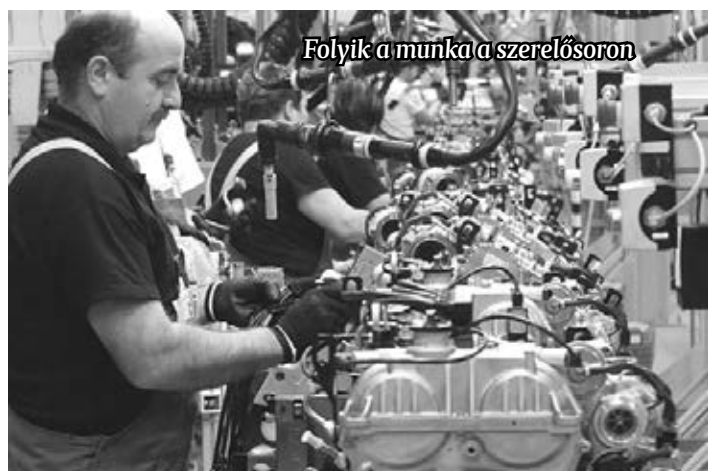
Folyik a munka a szerelősoron

– Büszkeséggel tölt el bennünket a tény, hogy az új Insignia alap benzines motorját, az 1.5-ös turbó benzineset mi fogjuk gyártani – mondta az ünnepségen Grzegorz Buchal, az Opel Szentgotthárd igazgatója. – Ezzel párhuzamosan továbbra is a szentgotthárdi gyár szállítja az összes motort az új Astrába, amelyre Európában ez idáig több mint 350.000 megrendelés érkezett 2015 óta. Ennek köszönhetően az Opel Szentgotthárd rekord