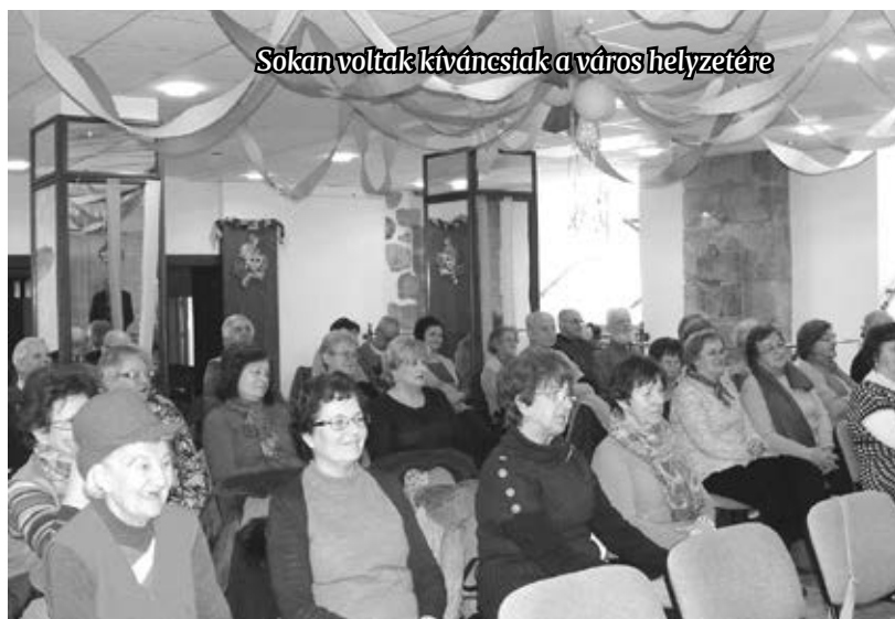
Sokan voltak kíváncsiak a város helyzetére

szennyvízberuházás nyomán rendbe teszik az érintett járdákat is.