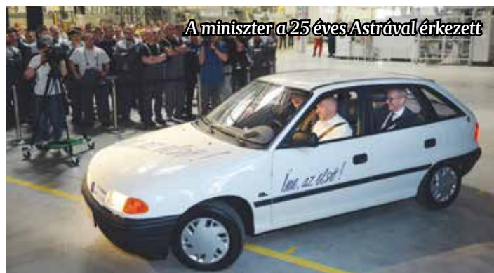
A miniszter a 25 éves Astrával érkezett

szül az a 1.5-ös benzines turbó motor, amely az új Insignia lelke lesz. A Crossland X modell az első eredménye annak az együttműködésnek, amelyet a PSA csoporttal öt évvel ezelőtt elkezdtek, s reméli, hogy a GM és a PSA mérnökeinek együttműködése további nagy dolgokra lesz majd képes. A