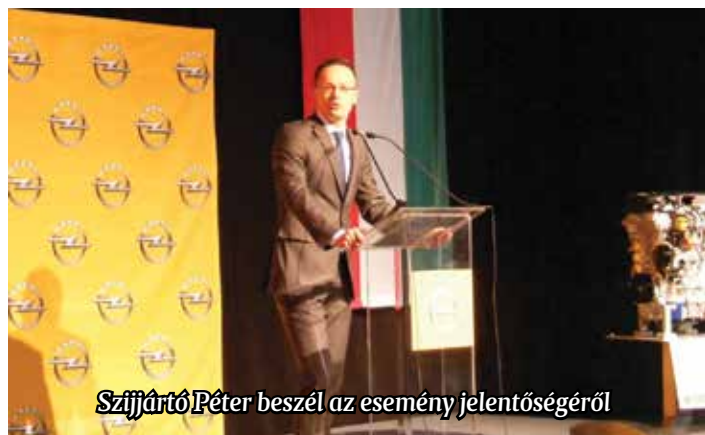
Szijjártó Péter beszél az esemény jelentőségéről

motorok többségét itt gyártják, gotthárdi motorral működik a 2016-ban az év autója díjat kapott Opel Astra, és itt ké-