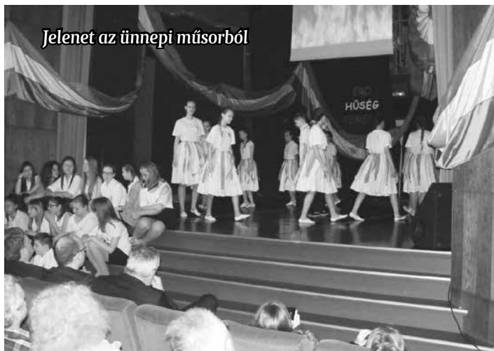
Jelenet az ünnepi műsorból

got látni, tanulni, nyelveket szólni, és visszatér, mert hisz abban, hogy a Szózat szavával élve „még jöni kell, még