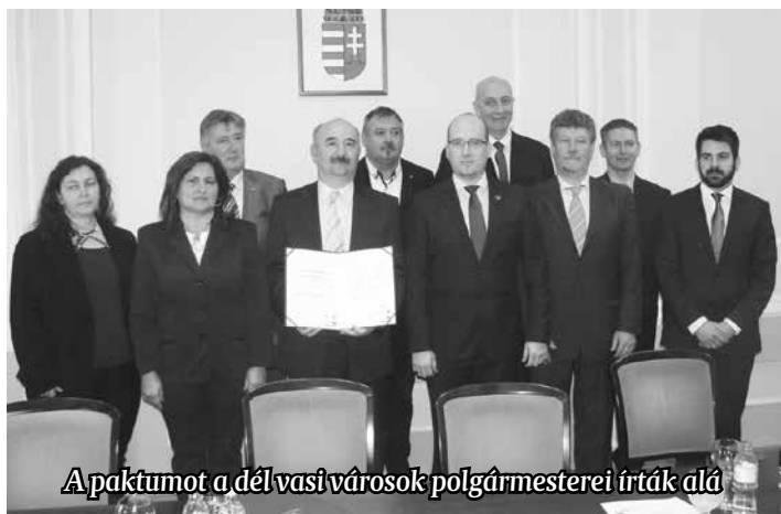
A paktumot a dél-vasi városok polgármesterei írták alá

az lesz, hogy a jelenlegi munkaerőhiányra megtalálják a foglalkoztatási programok a megfelelő választ. Fel kell