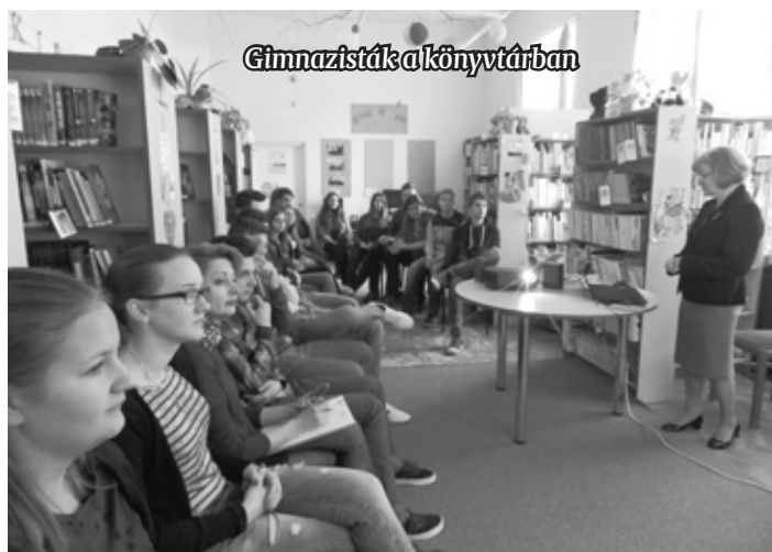
Gimnazisták a könyvtárban

Ezzel alapozta meg a személyiség fejlődésének fázisait, a genetikai örökség és a szocia-