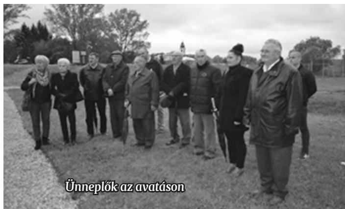
Ünneplők az avatáson

az önkormányzat 2017. áprilisában felújította a zászlót formázó parkrészt nyugati felét a zászlólyukat szimbolizáló köröndig, a köröndöt is beleértve, valamint az északnyugati sétányra ránótt fenyőfákat felnyíratva, annak érdekében, hogy a látogatók körbesétálhassák a területet.