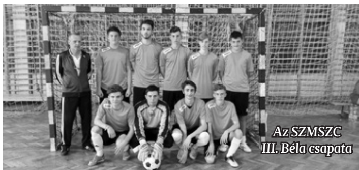
Az SZMSZC III. Béla csapata

Iskolánk csapata mellett Szlovéniából Muraszombat, Vas megyéből a körmendi Kölcsey Ferenc Gimnázium és a Vörösmarty Mihály Gimnázium, illetve a Széchenyi István Általános Iskola csapata