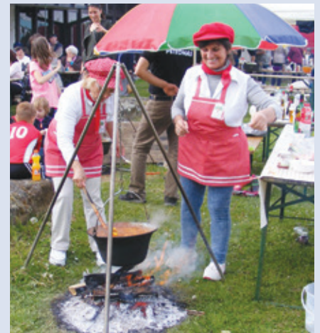
Főz a győztes csapat