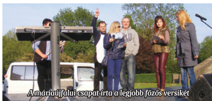
A máriaújfalu csapat írta a legjobb főzős versikét

igen. A Természetjárók Baráti Köre alkalmi konyháján is már bugyborékolat az étel. Legényfagó, piroskás, pityókás pincepörkölt készült. Itt a pityóka többféle értelemben is szerepelt. Elég sok volt a lé, de megnyugtattak, hogy majd