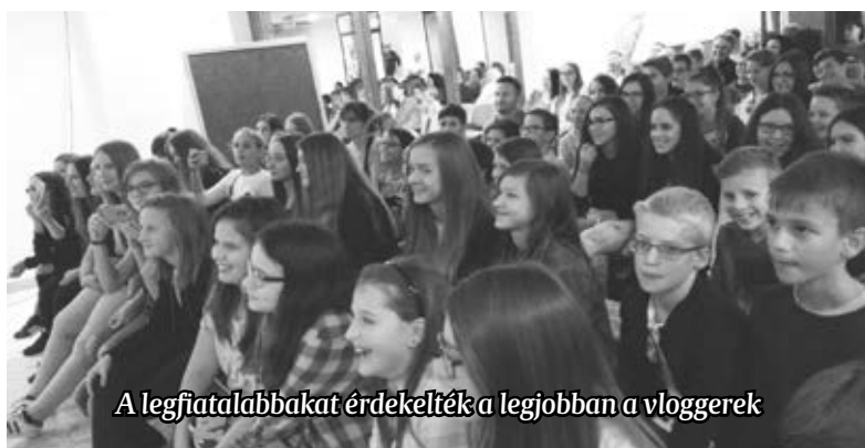
A legfiatalabbakat érdekelték a legjobban a vloggerek