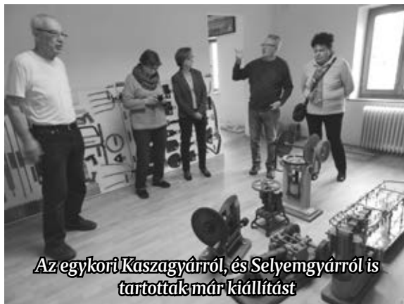
Az egykori Kaszagyárról, és Selyemgyárról is tartottak már kiállítást

A hagyományos kiállítás mellett virtuális kiállítást is tervez az intézmény. A virtuális kiállítás lehetőséget nyújt