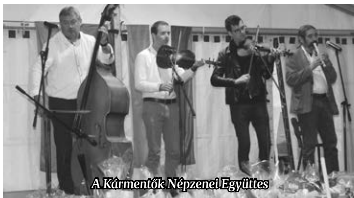
A Kármentők Népzenei Együttes