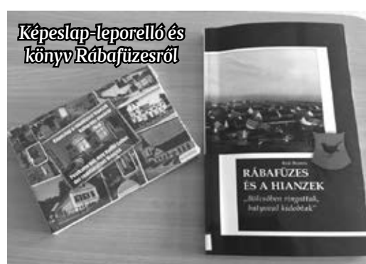
Képeslap-leporelló és könyv Ráabafüzesről