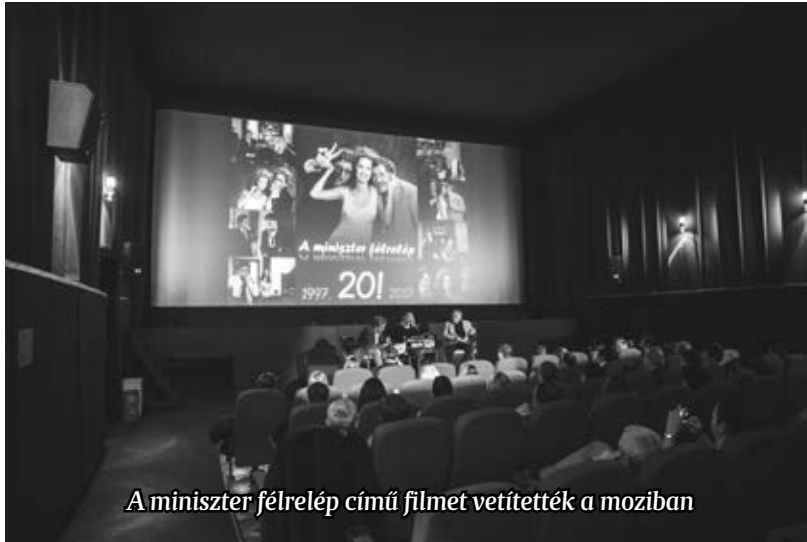
A miniszter félrelép című filmet vetítették a moziban

Sztoriként emlékeztek arra, hogy annál a jelenetnél, amikor az egyik szereplőnek ki kellett repülnie a tolokocsijából a cukorból készült „üvegablakon át”, a filmforgatási mûszak legizmosabb emberei sem tudták úgy meglökni, hogy áttörje az „üveget”. Mire