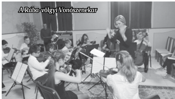
A Rábavölgyi Vonószenekear