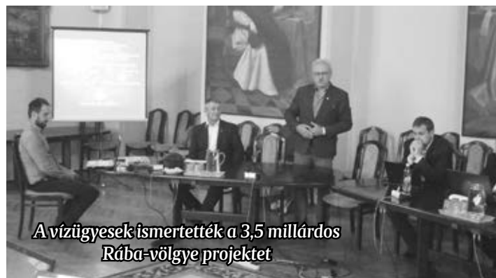
A vízügyesek ismertették a 3,5 milliárdos Rába-völgye projektet