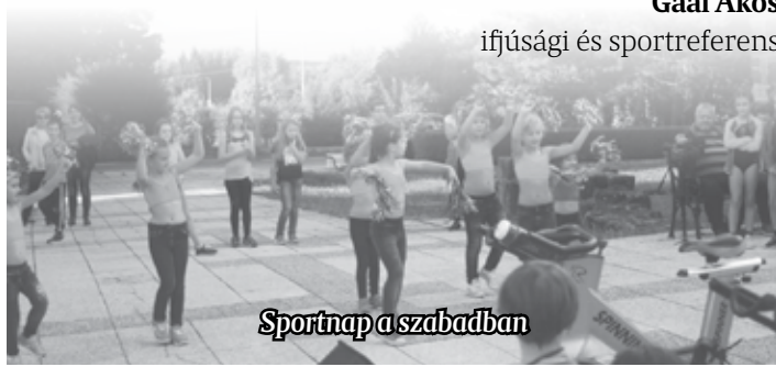
Sportnap a szabadban