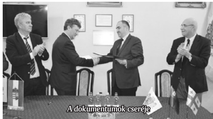
A dokumentumok cseréje

A két településről rövidfilmeket vetítettek, ennek során Szentgotthárd a Szerelmesek Fesztiváljából adott ízelítőt a vendégeknek. A grúzok egy kisfilmet hoztak a város ünnepéről is, amelyre rendre meghívják a testvérvárosok küldöttségeit. Mielőtt a két polgármester ünnepélyesen kézjeggyel látta el az együttmű-