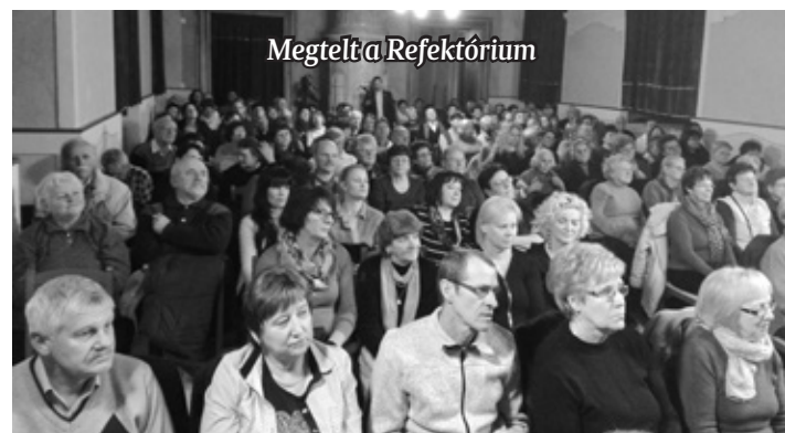
Megtelt a Refektórium

örömmel fogadja. Lehetséges egy bizonyos ideig való tanulás után – a hit legalapvetőbb ismeretének elsajátítását, elfogadását követően –, az egyház életébe való bekapcsolódást követően nyitva áll előtte a szentségek felvételének lehetősége. S ha mindketten szabadállapotúak, akkor egy-