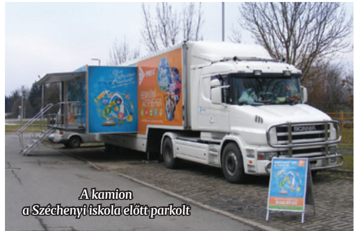
A kamion a Széchenyi iskola előtt parkolt

arra, hogy mit rejt a jármű belseje, milyen információkkal szolgálhat. Olyan csoport is érkezett, amely nem titkolta fenntartásait és ellenérzését az új beruházással kapcsolatban, s ezt a kérdéseik is tükrözték. Egy interaktív táblán azt is megtudhatták, hogy a nap mely részében, mekkora az ország elektromosáram-felhasználása. Mint kiderült, az adott időben csaknem kétszer akkora volt az energia-fel-