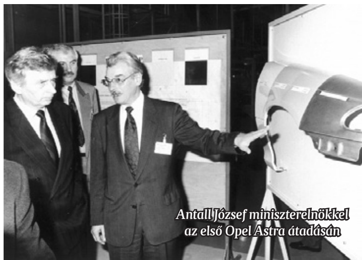
Antall József miniszterelnökkel az első Opel Astra átadásán

tartózkodásán, hiszen úgy beszélhetett mindenkinek a gyárról, mint szülő a kedvenc gyermekéről. És eljött a nagy nap, 1992. március 13. péntek, az első Opel Astra ünnepélyes megszületése, amely körül a cég európai első embere,