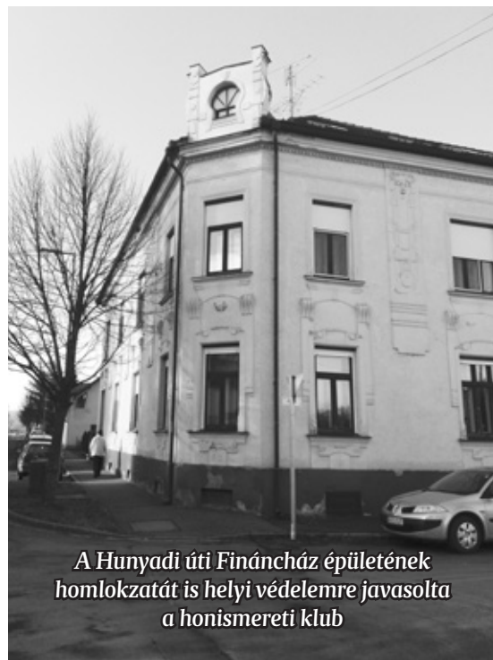
A Hunyadi úti Fináncház épületének homlokzatát is helyi védelemre javasolta a honismereti klub

elhanyagolt partokon akár kisebb parkokat is kialakíthatnának. Szép környezetben fekszik a mesterségesen kialakított Hársas-tó Máriaújfalu határában.