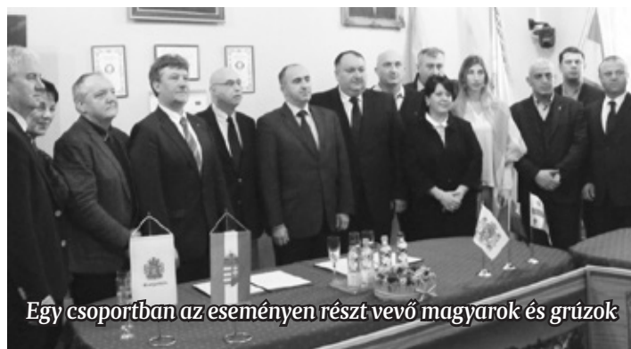
Egy csoportban az eseményen részt vevő magyarok és grúzok

kultúrájának, történelmének, értékeinek megismerése. Szentgotthárdon van egy szép fürdő és egy négycsillagos