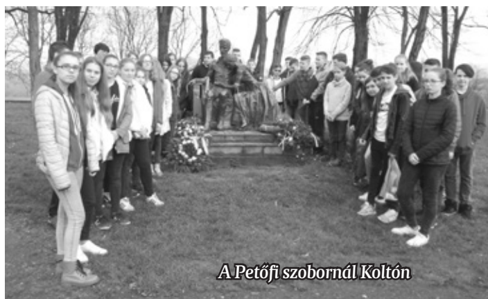
A Petőfi szobornál Koltón

télyt csak kívülről nézhettük meg, de az ottani vezetőnk elbeszélése alapján el tudtuk képzelni belülről is. Utunk Erdődre vezetett, ahol az egykor gyönyörű várkastélyból mára csak egy romos torony maradt fent. A kastély kápolnájában tartották 1847-ben Petőfi és Szendrey Júlia esküvőjét. Ezek után Szatmárnémetibe indul-