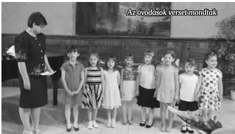
Az óvodások verset mondtak

A Soproni Egyetem Benedek Elek Pedagógiai Kara, mint a Soproni Óvónőképző Intézet jogutódja, szeptem-