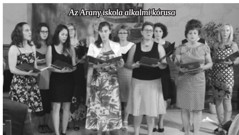
Az Arany iskola alkalmi kórusa

nyí iskola főzőkonyháját is korszerűsítik. Beszéde végén a polgármester ezt mondta: kívánom, hogy továbbra is maradjanak ilyen türelmes, lelkiismeretes tanítók, figyelmes tanárok, kedves terelgető óvónők.”