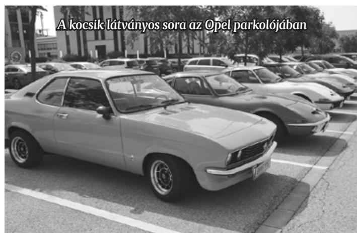
A kocsik látványos sora az Opel parkolójában