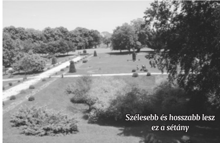
Szélesebb és hosszabb lesz ez a sétány

Felújítják a Várkert útjait, új sétányokat, andalgókat is kialakítanak. Padok, két ivókút és nyilvános illemhely