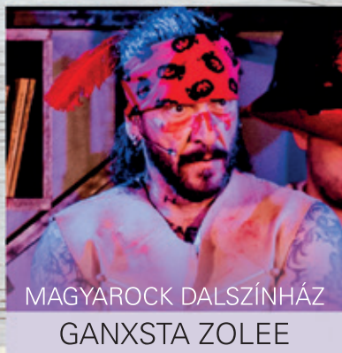
MAGYAROCK DALSZÍNHÁZ GANXSTA ZOLEE