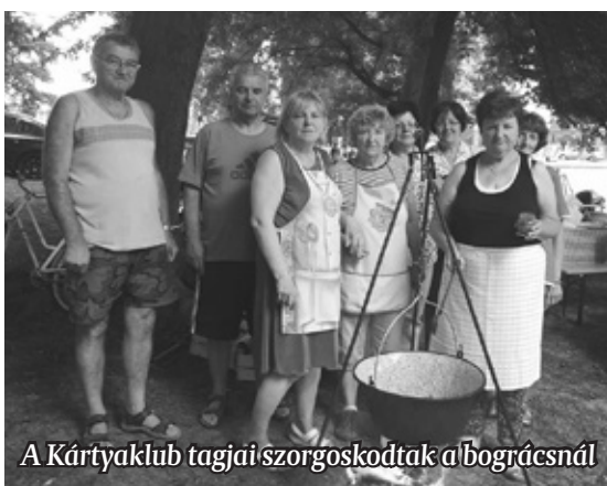
A Kártyaklub tagjai szorgoskodtak a bográcsnál