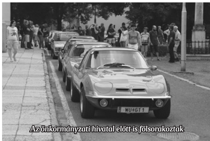
Az önkormányzati hivatal előtt is felsorakoztak

Megtudtuk tőlük, a klub 27 éve alakult, az országos hálózatnak mintegy száz tagja van, köztük jelentős számban nők is. Négynapos túrán vettek