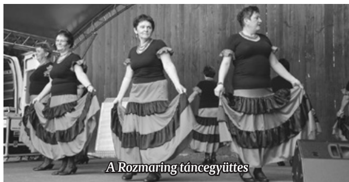
A Rozmaring táncegyüttes

sületének senior kórtánca: a csapat lejött a színpadról és a Várkert fűvén nagy körbe állva megtáncoltatta a közönséget is. A főzőcsapatok