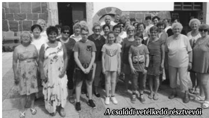
A családi vetélkedő résztvevői

talabb tagjai szívesen töltötték ki a labirintusos, szókeresős és rajzos feladatokat. Voltak könnyebb és nehezebb, gondolkodásra készítő feladatok is, melyekhez mindenki igénybe vehette, használhatta a legmodernebb technikai eszközöket is.