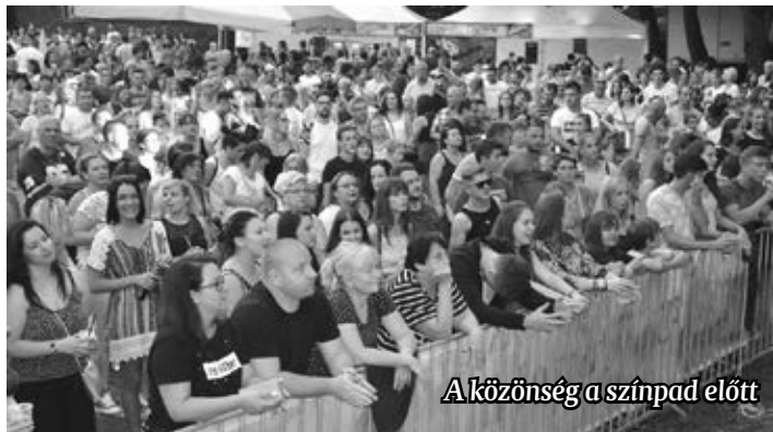
A közönség a színpad előtt