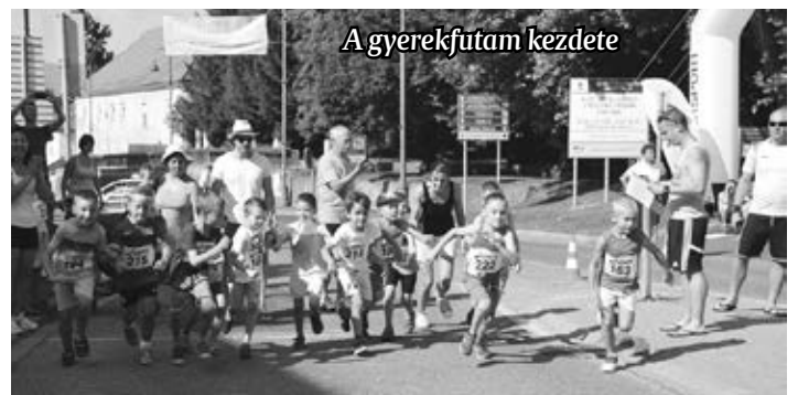
A gyerekfutam kezdete