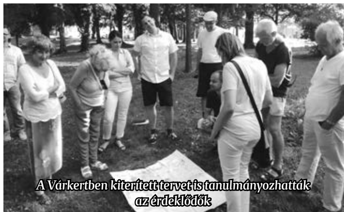
A Várkertben kiterített tervek is tanulmányozhatták az érdeklődők

történetét. Évszázadokkal ezelőtt milyen lehetett a Várkert, azt ma már nehéz felidézni. Az apátság történetét a dokumentumokból nyomon lehet követni, az 1183-as alapítástól kezdve, feltehetően a Rába jobb és bal partján is voltak azok a