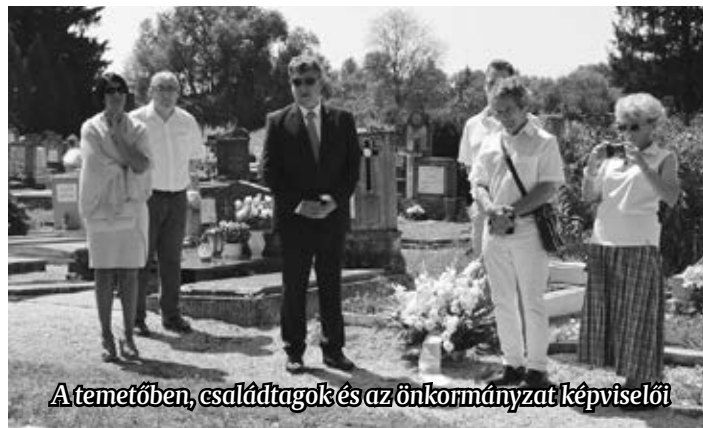
A temetőben, családtagok és az önkormányzat képviselői