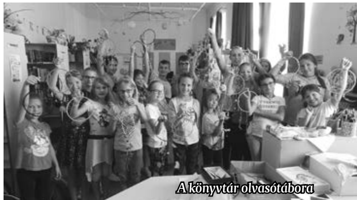
A könyvtár olvasótáborára

Sok időt töltöttünk a szabadban, ahol íjászokdtunk, buborék kigyót készítettünk és sokat játszottunk. Kézműves foglalkozás keretében papírmásé technikával mindenki