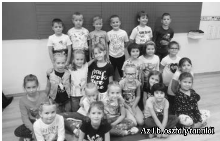
Az 1.b. osztály tanulói

tanári kar létszáma, ebből a szempontból szerencsésnek mondhatják magukat, hisz 100%-os a szakos ellátottság. Minden tantárgyat minden évfolyamon, képzett, tapasztalt pedagógusok oktatnak,