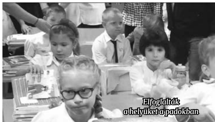
Elfoglalták a helyüket a padokban

akik túlnyomó többségben már évek, illetve évtizedek óta az iskola alkalmazásában állnak. Az iskola épületében karbantartási munkák folytak a nyáron. Teljes egészében megújult tantermekkel tudták fogadni az újonnan érkező ötödikeseket. Ugyancsak megszépült a tanári szoba és intézményvezetői iroda, ahol szalagparketta lehelyezésére és festésre került sor. A folyosókra új világítótestek kerültek, valamint az osztályterekben is kijavították, kicserélték a hibás vagy hiányzó neoncsöveket.