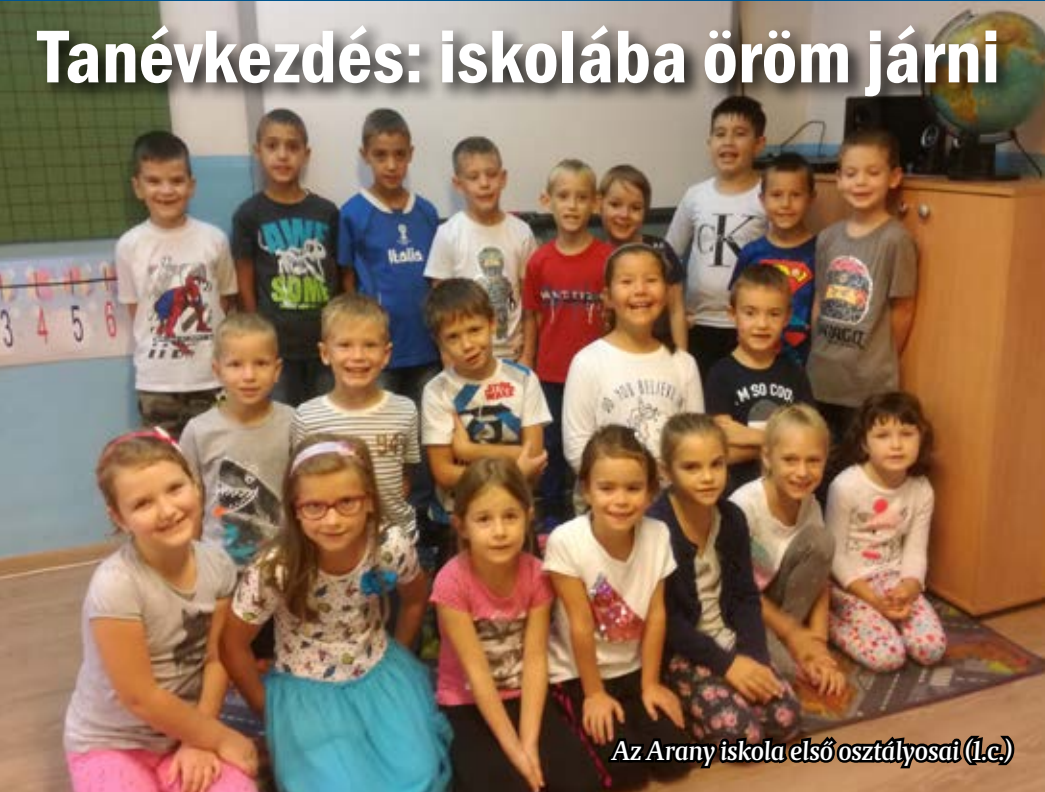
Az Arany iskola első osztályosai

Szentgotthárd két általános iskolájában és két középiskolájában szeptember elsején kezdődött a 2018/2019-es tanév. A hétvége miatt azonban csak szeptember 3-án ültek iskolapadokba a diákok. A Vörösmarty Mihály Gimnáziumban a 125. tanév vette kezdetét.