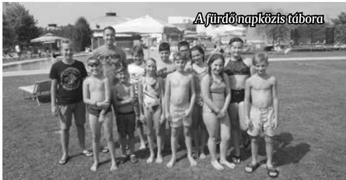
A fűrdőnapközis tábora

hatjuk, hogy a nyári táborok idején is sikeresek voltak.