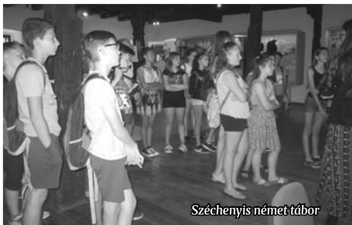
Széchenyis német tábor

Az Emberi Erőforrások Minisztériuma által kiírt „Nyelvi környezetben megvalósuló nemzetiségi, népismereti, művészeti, hagyományörző és olvasótáborok megvalósításának 2018. évi költségvetési támogatása” elnevezésű pályázaton 900 000 Ft-os támogatást nyertünk.