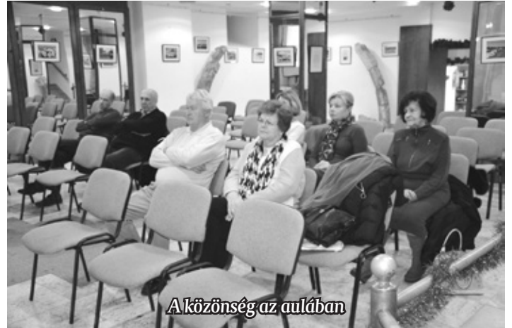
A közönség az aulában

leg nem volt ideje arra, hogy felvegye páncélzatát. A csata után Erdélyben folytatta hadjáratát, ahol leszámolt a helyi