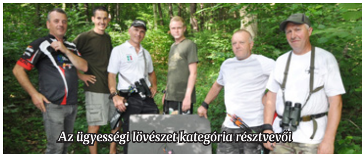
Az ügyességi lövészet kategória résztvevői

Június 15-én rendezte a Szentgotthárdi VSE Szent Sebestyén íjászköre ez évi 3D íjászversenyét a Hársas tó körül. A helyszín kitűnő terepet biztosított a 40 db 3d jellegű állatcél elhelyezésére, mely kihívás elé állította a 125 fős mezőnyt.