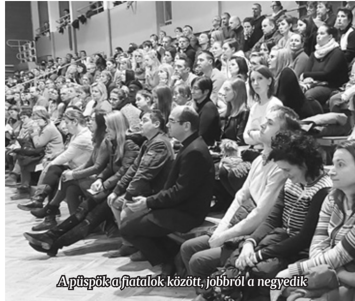
A püspök a fiatalok között, jobbról a negyedik

a gyermek óriási kincse a szülőknek, akinek a legtöbbet, a legjobbat szeretnék megadni. A kereszténység 2000 éve nagy figyelmet fordított a gyermekek, fiatalok nevelésére. Történelme