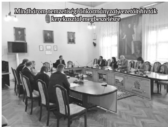
Mindhárom nemzetiségi önkormányzat vezetőit hívták kerekasztal-megbeszélésre

egyéni és közösségi jogai alapvető szabadságjogok, ezeket tiszteletben tartja, nekik érvényt szerez.