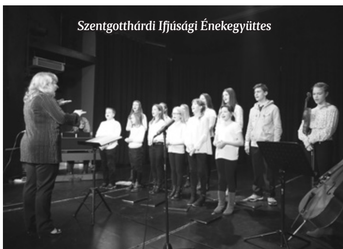
Szentgotthárdi Ifjúsági Énekegyüttes