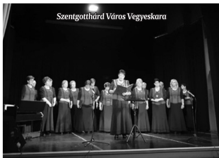
Szentgotthárd Város Vegyeskara