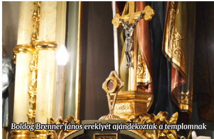
Boldog Brenner János ereklyét ajándékoztak a templomnak

Egyház boldogként, szentként tiszteli, bizonyítják, hogy ezek a boldogság mondások igazak, ezek valóságosak, ezek az embernek valók, és az embert Krisztushoz hasonlóvá formálják. Ezt látjuk Brenner