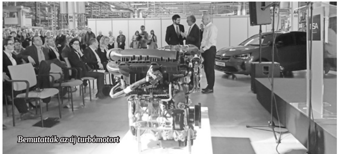
Bemutatták az új turbómotort

károsanyag-kibocsátású motor fejlesztését a vállalatcsoportnál. A kis teljesítményű benzinmotort eredetileg kis autókba szánták, de előnyös