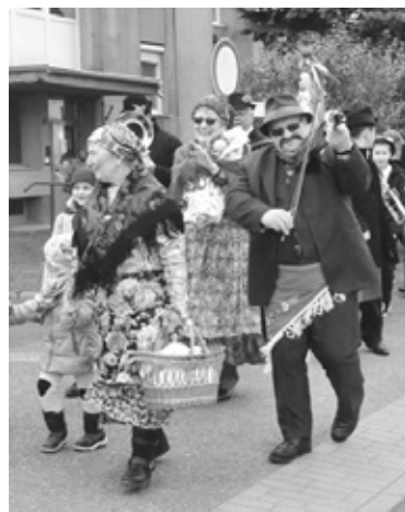
Szlovének Hivatala, a társszervezők és az egyesület tagsága. (t. m.)

A farsangi rendezvényt támogatta a Bethlen Gábor Alapkezelő Zrt., a Határon Túli