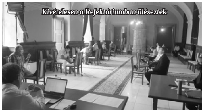
Kivételesen a Refektóriumban üléseztek

2014 óta a JustFood Kft. látja el a közétkeztetési feladatokat Szentgotthárdon. Az intézményvezetők és a szolgáltató részvételével kéthavonta megtartott személyes egyeztetések tapasztalatai alapján elmondható, hogy a közétkeztetés ellátása során a szolgáltató figyelembe veszi az intézmények észrevételeit, rugalmas hozzáállással oldja meg a kéréseket. A jogszabályi előírásokban megfogalmazottakat betartják, figyelnek a változatos, egészséges táplálkozás biztosítására.