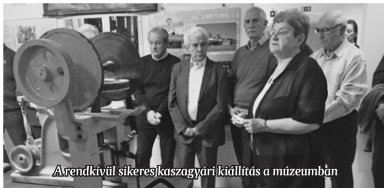
Arendkívül sikeres kaszagyári kiállítás a múzeumban

A szentgotthárdi Pável Ágoston Helytörténeti és Szlovén Nemzetiségi Gyűjtemény