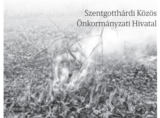
Szentgotthárdi Közös Önkormányzati Hivatal

Szeptember 1. után a veszélyhelyzeti szabályoktól függően alakul a szabályozás, amelyről a lakosságot tájékoztatjuk.