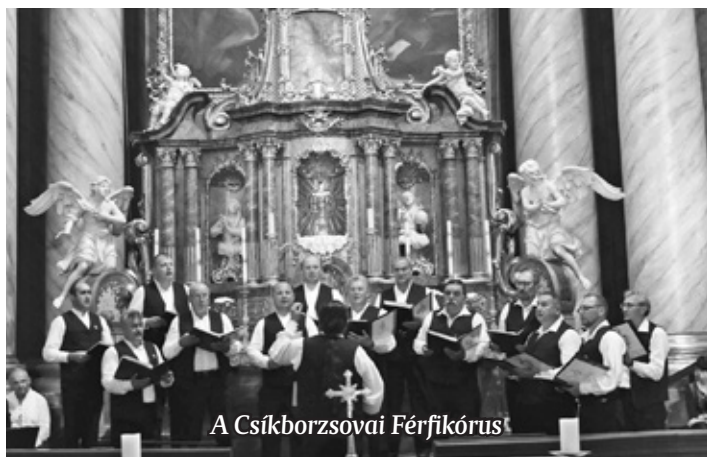
A Csíkborzsovai Férfikórus

Város Vegyeskara. Az első kórus 1962-ben alakult a városban, majd a 90-es évek elején két kórus is működött a városban, és 1997-ben ezek egyesítésével létrejött egy, a város igényeinek megfelelő kórus, Szentgotthárd Város Vegyeskara, akkortájt 40-45 taggal, jelenleg 25 tagja van. A kórus méltó utódként képviseli az énekes kultúrát a váro-