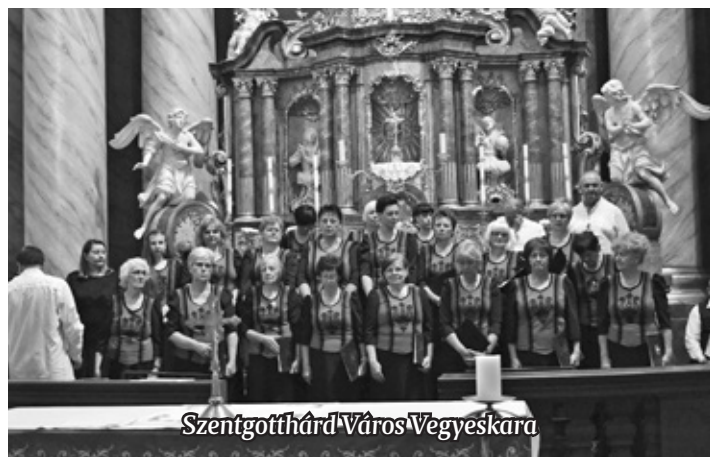
Szentgotthárd Város Vegyeskara

duk a régi énekek, népdalok, katonadalok felelevenítése, a fiataloknak való átadása. Az éneklés közösségépítő