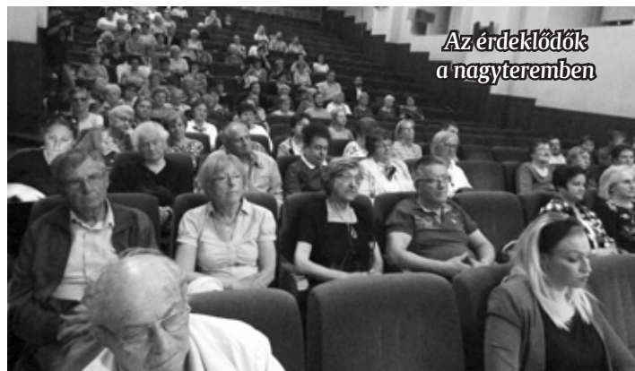
Az érdeklődők a nagyteremben