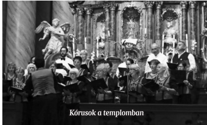
Kórusok a templomban

Ezt követően a Szentgotthárd Város Vegyeskara örvendeztette meg a közönséget néhány különleges dallal. A csoport bemutatásakor elhangzott, hogy a kóruskultúra jelenléte Szentgotthárdon a helytörténeti leírásokban 1873