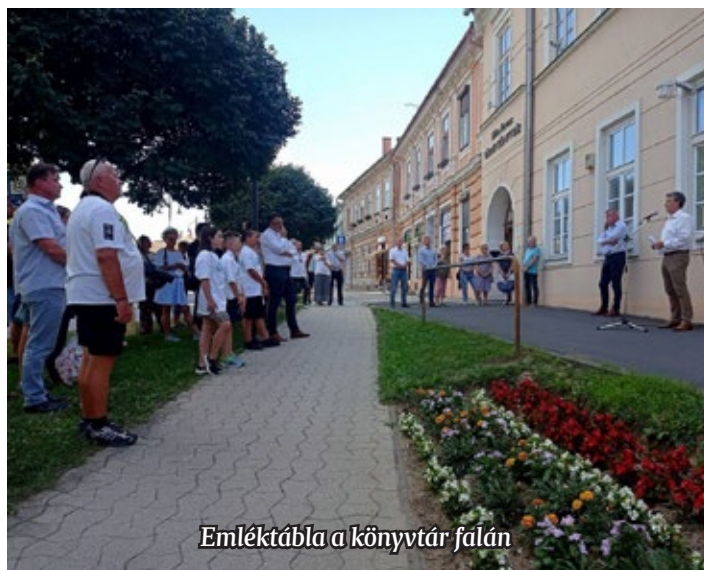
Emléktábla a könyvtár falán

V. Németh Zsolt miniszterelnöki biztos, a térség országgyűlési képviselője elmondta, Budapesten és az országban is jól ismerik Szentgotthárd nevét és gyakran rácsodálkoznak arra is, hogy egy mindössze kilencezres városról van