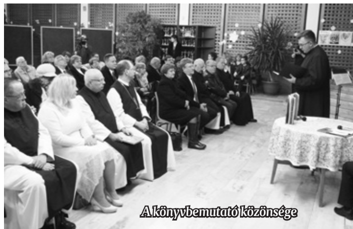
A könyvbemutató közönsége