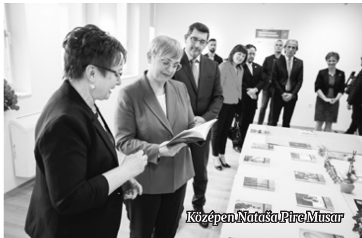
Középen Nataša Pirc Musar

Magyarországi Szlovének Országos Szövetsége