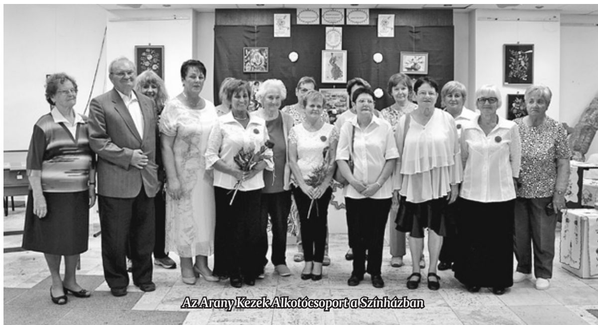
Az Arany Kezek Alkotócsoport a Színházban