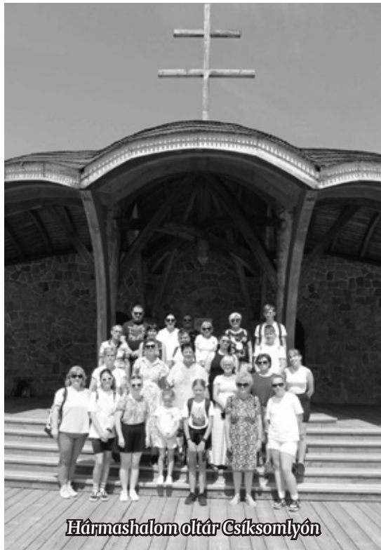
Háromszalonnai oltár Csíksomlyón

Nagyváradon a híres püspöki palotát és a Szent László-templomot tekintették meg, Marosvásárhelyen a Kultúrpalotát. Korondon a helyi kézműves mesterségekkel ismerkedtek,