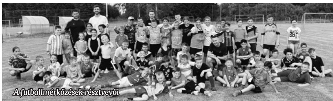
A futballmérkőzések résztvevői

Asportnap keretében különböző versenyeket és játékokat szerveztek, ezek nagy népszerűségnek örvendtek. A foci pályán gyermekek és felnőttek mérhették össze ügyességüket, miközben a nézők lelkesen