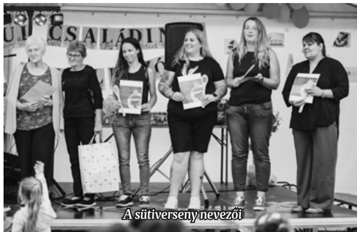
A sütőverseny nevezői

régi kapcsolatok megerősödjenek. A közös programok, a versenyek és a közös étkezések mind hozzájárultak ahhoz, hogy igazán összetartó és erős közösség alakuljon ki.