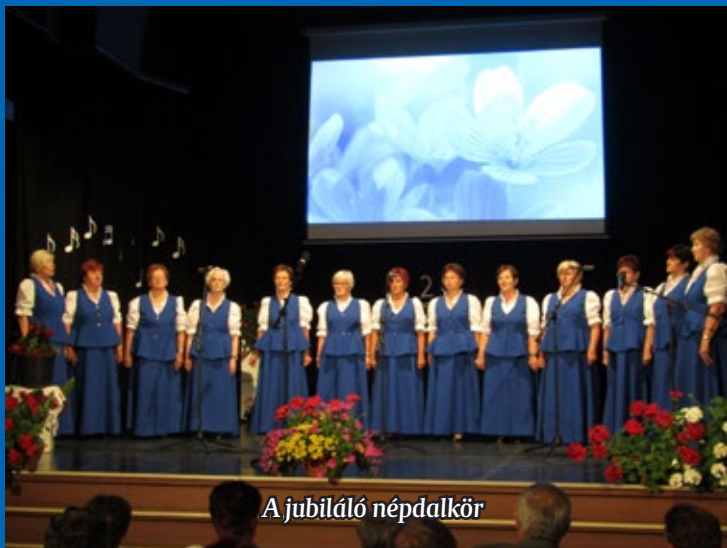
A jubiláló népdalkör

A Békefi Antal Népdalkör 25 éves jubileumát ünnepelték július 5-én a Színházban. A rendezvényt az „Életet az éveknek” Országos Szövetség megalakulásának 35. évében, a Népi Kultúra Napja jegyében közösen tartották.