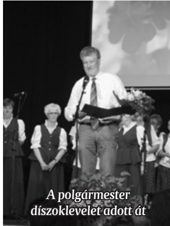
A polgármester díszoklevelet adott át

alakítottak ki Vas megyei és országos kórusokkal.