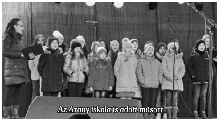
Az Arany iskola is adott műsort

egyre többen látogattak ki a programra. A 20 éves Zaporozsec zenekar – amely tavaly a Fonogram-díjat is bezsebelte – koncertje előtt zsúfolásig megtelt az Üvegkutyá környéke, kigyózó sorok álltak a forralt boros bódéknál, a Móra Ferenc Városi Könyvtár és Múzeum munkatársai és a vállalkozó szellemű gyerekek az összes mézeskalácsot