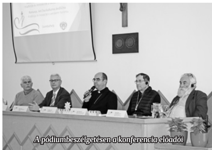
A pódiumbeszélgetésen a konferencia előadói