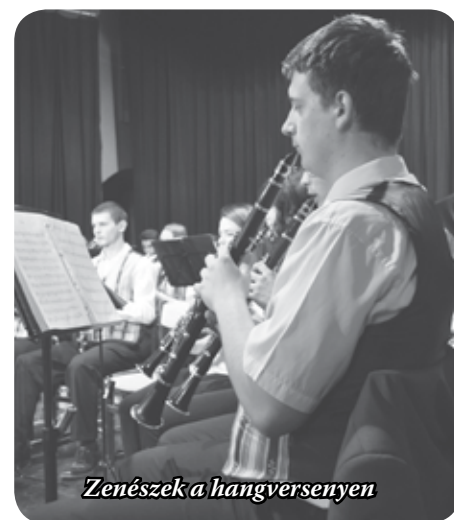
Zenészek a hangversenyen