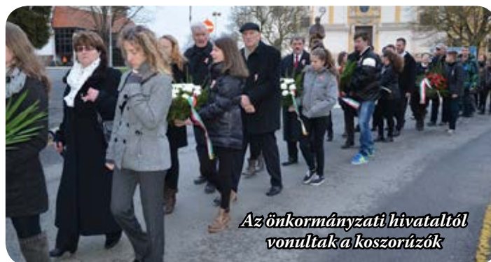
Az önkormányzati hivataltól vonultak a koszorúzók

A szabadságharc ugyan a túlerővel szemben elbukott, de a kegyetlen megtorlás ellenére előkészítette a kiegyezést, és azt a példátlan történelmi fejlődést,