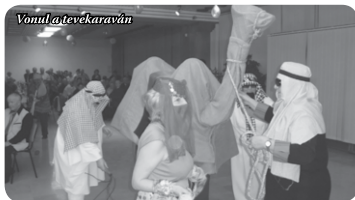
Vonul a tevékaraván

megyei zsűri, ahol az egyesület a tevékaraván jelenettel első díjas lett.