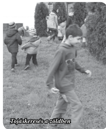
Tojáskeresés a zöldben