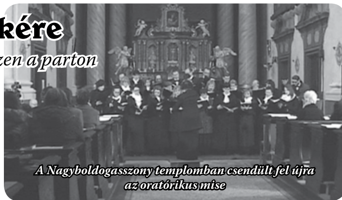
A Nagyboldogasszony templomban csendült fel újra az oratórikus mise