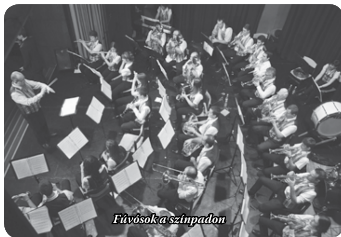
Fúvósok a színpadon