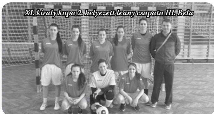
XI. király kupa 2. helyezett leány csapata III. Béla

A városi sportcsarnokba kilátogató közönség nagy csa-