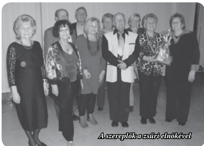
A szereplőka zsűri elnökével

Az egyesület tagjai szabadidejükben kulturális, oktatási, sport, egészségügyi, kézműves tevékenységük mellett humoros jelenetekkel is szórakoztatják az érdeklődőket. Ezt értékelte a