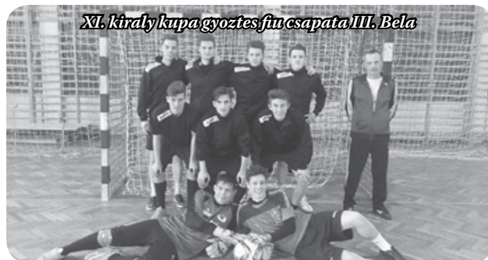
XI. király kupa győztes fiú csapata III. Béla