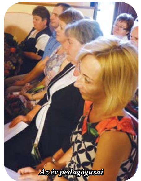
Az év pedagógusai

Szentgotthárdon június 6-án köszöntötték a tanítókat, tanárokat, óvónőket pedagógusnap alkalmából. A hagyományokhoz híven az önkormányzati hivatal Refektóriumában tartott ünnepségen adták át a díszokleveleket, és kiosztották „A 2015/2016-os Tanév Pedagógusa Szentgotthárdon” címet, valamint a Szentgotthárd Város Közoktatásáért Díjat.