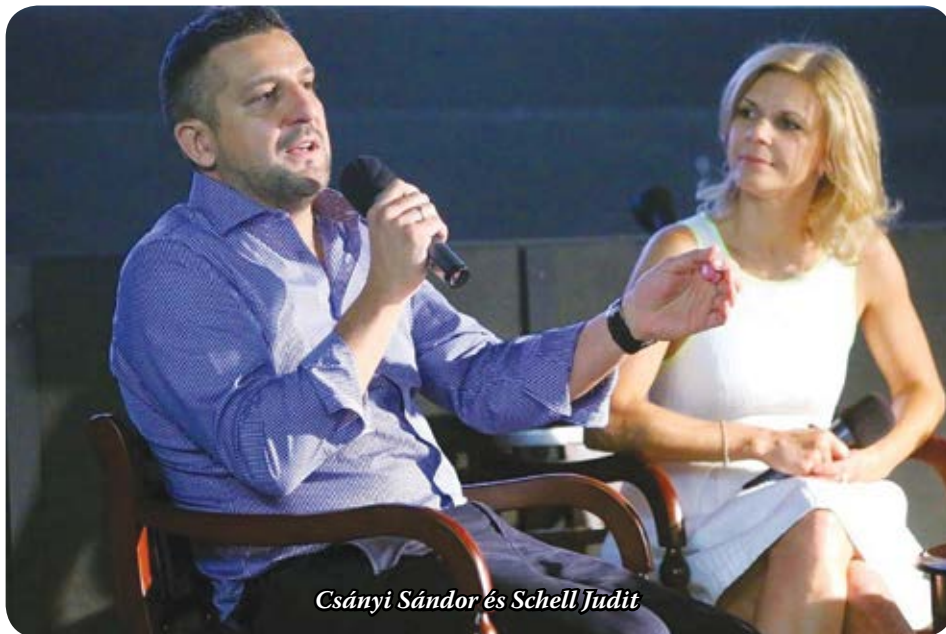
Csányi Sándor és Schell Judit