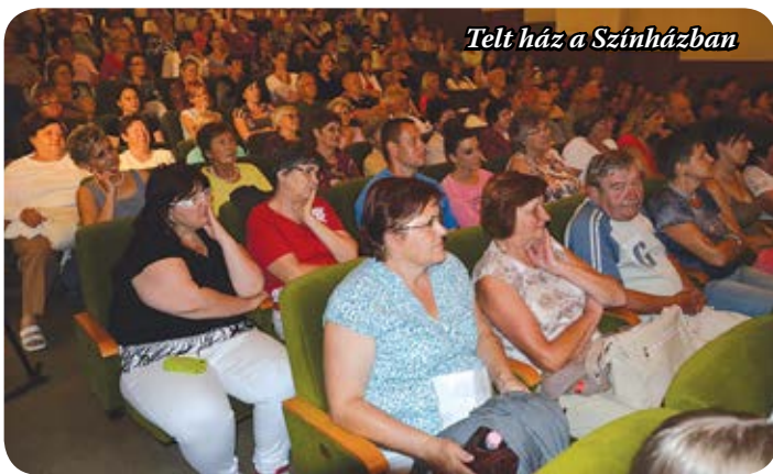
Telt ház a Színházban

várta az edzések után a versenypálya bejáratánál, mindhiába. Később kiderült, hátul szökött ki előle... Ötgyerekes családban nőtt fel, szigorú katolikus nevelésben részesült, sokáig hitte is, hogy a szexualitást kizárólag gyermeknemzés céljából lehet gyakorolni. (Szülei magas kort értek meg, több mint hetven