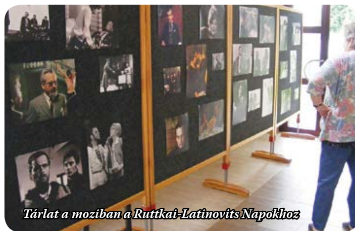
Tárlat a moziban a Ruttkai-Latinovits Napokhoz

vonatbalesetet öngyilkossággént beállítani. Az elmúlt csaknem négy évtized során még soha senki nem nyomozott Latinovits Zoltán halála körülményei után olyan alaposan, szenvedéllyel, kíméletlenül kitartó munkával, szakértelemmel, mint ő, s úgy érzi, pontot tett a találgatások végére. Nagy nehézségek árán