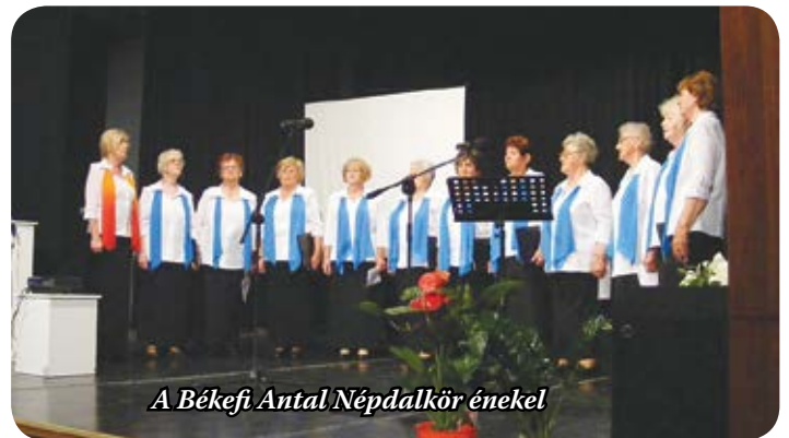
A Békefi Antal Népdalkör énekel

Utalt arra, hogy a városban több mint 60 civil szervezetet kell összefogni. Ezek között kitűnő