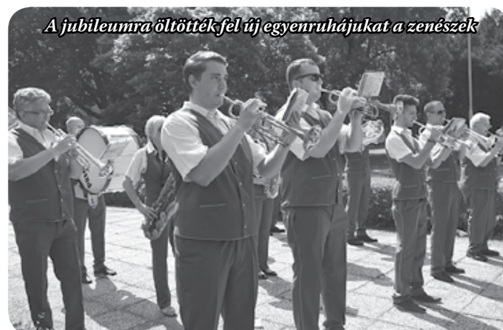
A jubileumra öltötték fel új egyenruhájukat a zenészek