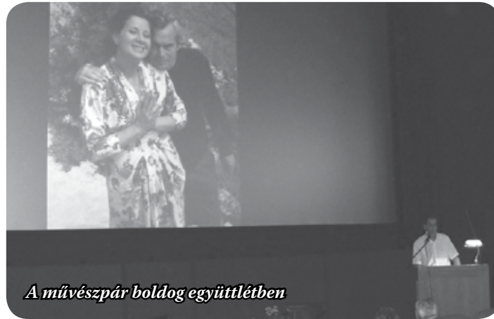
A művészpár boldog együttlétben

kezés segítségével arról beszélt, egy óriási Latinovits-alakításnak volt részese együttesével és Weöres Sándor költővel együtt, amit